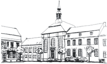
LINNICH, ALTER MARKT 1918 G.R.